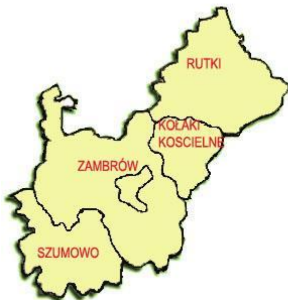
Rysunek 1. Gmina Rutki na tle powiatu zambrowskiego

Według danych z 2020 roku ludność Gminy wynosi 5.427 mieszkańców, a gęstość zaludnienia to w przybliżeniu 27 osób/km 2 . W strukturze wieku ludności przeważają osoby w wieku produkcyjnym (3.490).